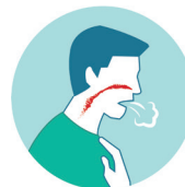
Souffle court Shortness of breath